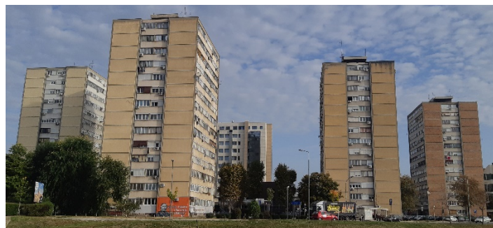
Slika 3. Jugozapadno orijentisane fasade solitera S4-S7

Spoljašnjost izučavanih solitera je takva da su dve suprotne fasade potpuno pokrivene prozorima, dok se ostale dve sastoje od po dve slobodne površine razdvojene jednom kolonom prozora. Ovo znači da su na svim soliterima osim na soliteru S3 fotonaponski paneli postavljeni na četiri površine od kojih se po dve nalaze na fasadama koje su na suprotnim stranama sveta (Slika 3).