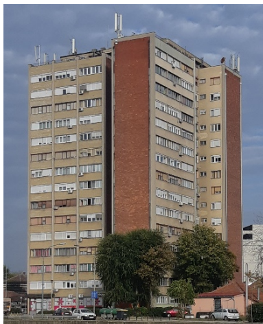
Slika 4. Jugoistočno i severoistočno orijentisane fasade solitera S3

zidove solitera, to znači da je ugao nagiba panela iznosio 90°. Optimalan ugao nagiba panela je parametar sistema sa značajnim uticajem na generisanje električne energije i kao takav je tema opsežnih istraživanja [26-28]. U ovom radu on nije proučavan pošto bi efekat senki u fotonaponskim sistemima značajno uticao na složenost modeliranja i simulacije i smanjio korisnu površinu na fasadama za postavljanje panela. Broj panela je izabran tako da se maksimalno iskoriste površine fasada, uz vođenje računa o dodatnoj površini potrebnoj za izvođenje radova na instalaciji i održavanju sistema.