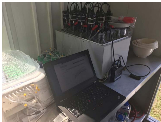
Slika 1. Deo laboratorijske opreme na kojoj su vršeni eksperimenti

ćelija za merenje protoka i procesorske jedinica za upravljanje procesom i akviziciju podataka.